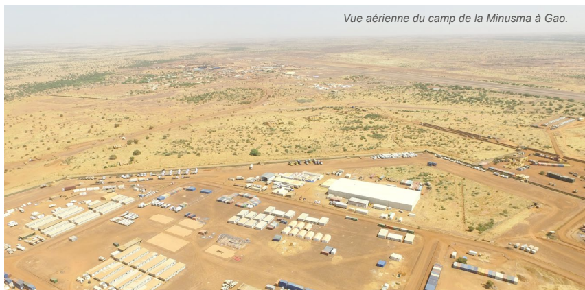
Vue aérienne du camp de la Minusma à Gao.