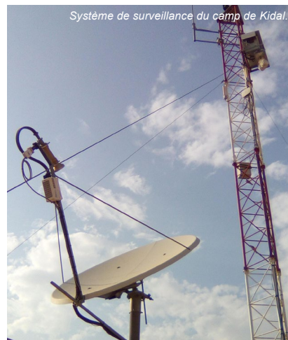
Système de surveillance du camp de Kidal.

Elle s'appuie également sur le réseau institutionnel français (Affaires étrangères, Economie et Finances, Défense) et a su nouer une relation étroite avec l'ONU.