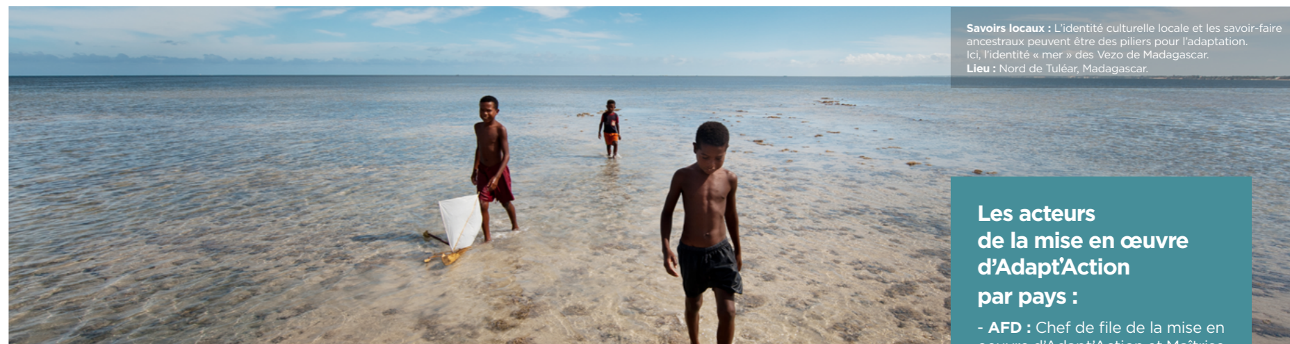
Savoirs locaux : L'identité culturelle locale et les savoir-faire ancestraux peuvent être des piliers pour l'adaptation. Ici, l'identité « mer » des Vezo de Madagascar. Lieu : Nord de Tuléar, Madagascar.

Le succès de l'Accord de Paris sur le climat en décembre 2015 repose sur l'ampleur de l'engagement des pays dans le cadre de la COP21, illustré par la soumission de leur Contribution Déterminée au niveau National (CDN). Le défi à relever est désormais celui de son opérationnalisation par la mise en œuvre des différentes contributions nationales. Un grand nombre de pays en développement, signataires de l'Accord, ont clairement indiqué leur souhait d'obtenir un appui technique dans le déploiement institutionnel, méthodologique et opérationnel de leur CDN et l'atteinte des objectifs fixés.