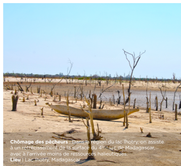
Chômage des pêcheurs : Dans la région du lac Ihotry, on assiste à un rétrécissement de la surface du 4 ème lac de Madagascar, avec à l'arrivée moins de ressources halieutiques. Lieu : Lac Ihotry, Madagascar.

Sommet sur le Climat à Paris : anniversaire de l'Accord de Paris sur le Climat.