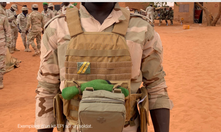
Exemplaire d'un kit EPI sur un soldat.

Les conventions-cadre conclues avec tous les pays du G5 précisent que les biens, services et travaux procurés par Expertise France deviennent la propriété des Etats, mais que ceux-ci sont dans l'obligation de les mettre à disposition de la FCG5.