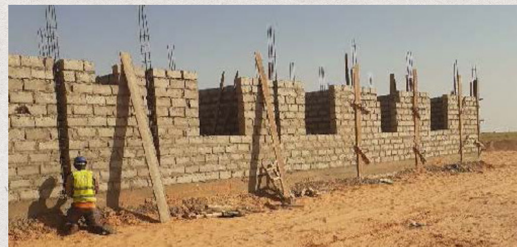
Les travaux du PC Ouest en Mauritanie emploient environ 100 ouvriers chaque mois.