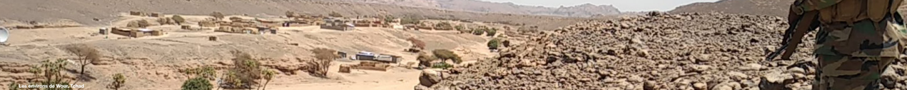
Les environs de Wour, Tchad