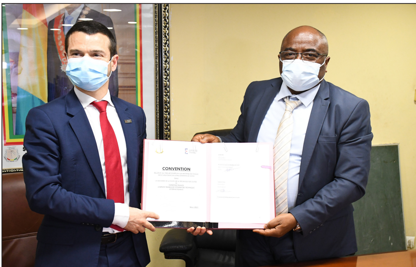
Signature du protocole d'accord entre Expertise France et le Ministère de la Santé et de l'Hygiène publique de Guinée