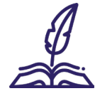
Entrepreneuriat culturel et industries culturelles et créatives